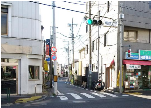
五日市街道からの入り口

杉並区は、2017年（平成29年）に策定した道路整備方針で、主要生活道路の拡幅計画を発表。計画のなかで、五日市街道から高千穂大学までの道路幅を、約5メートルから左右広げて9メートルに拡幅することが示されました。 拡幅工事が行われれば、約150世帯の方が、立ち退きを迫られる恐れがあります。 区は、道路拡幅の目的に、防災性や安全性をあげていますが、住民からは「現在のままでも特に防災上問題はない」「長年住み慣れたところから、今さら立ち退きと言われても困る」などの声があがっています。