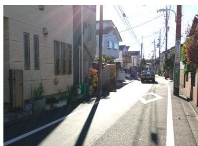
成田東1丁目付近の住宅