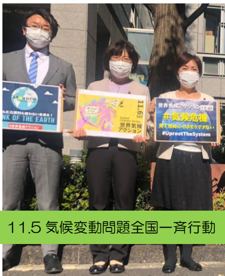
11.5 気候変動問題全国一斉行動

ゼロカーボンシティ宣言とは、地方公共団体における脱炭素化の取り組みの一環で、現在40都道府県、287市、12特別区、140町村が表明しています。